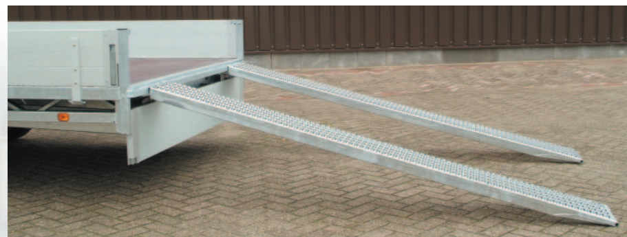
▲ Rijplaten, 250 cm lang