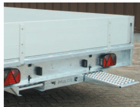
▲ De rijplaten worden onder het chassis in rijplaathouders opgeborgen