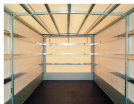
▲ Het huifgeraamte met aluminium planken is zeer stabiel