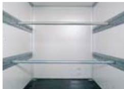
Rails met ladingstang (t.b.v. houten opbouw)