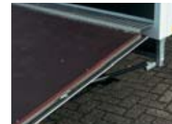
Oprijklep met inlegstuk en gasveren