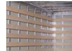
Latten binnenbekleding (t.b.v. aluminium opbouw)