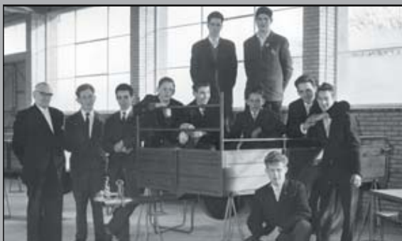
Sinds 1959 seriematige productie van aanhangwagens.