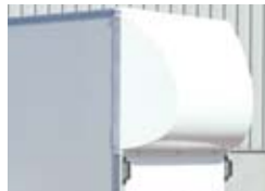
Spoiler (t.b.v. houten opbouw) (optie) Handgrepen standaard bij houten opbouw