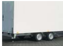
Verlaagd onderstel bij aluminium opbouwagens