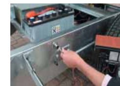
Bijlaadstekker (standaard bij elektrische Kippers)