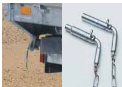
Overhoekse beveiliging bij driezijdige Kippers