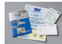
Uitgebreide garantie Saris TÜV gecertificeerd