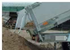
Dubbelscharnierend achterbord/40cm borden