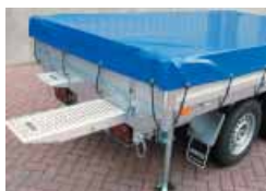
Vlakzeil of huif